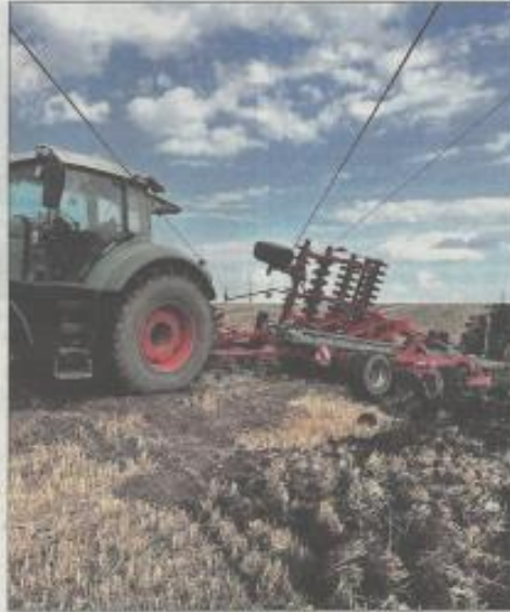
Dégât d'une ligne HTA sur la commune de Hayas.

Les lignes électriques aériennes rencontrées par les exploitants agricoles lors de leurs travaux agricoles sont essentiellement de type HTA composées de trois fils nus accrochés sur des armatures métalliques fixées en partie haute des poteaux béton, ou bois occasionnellement. La hauteur réglementaire de ces lignes électriques est à minima de 6 mètres