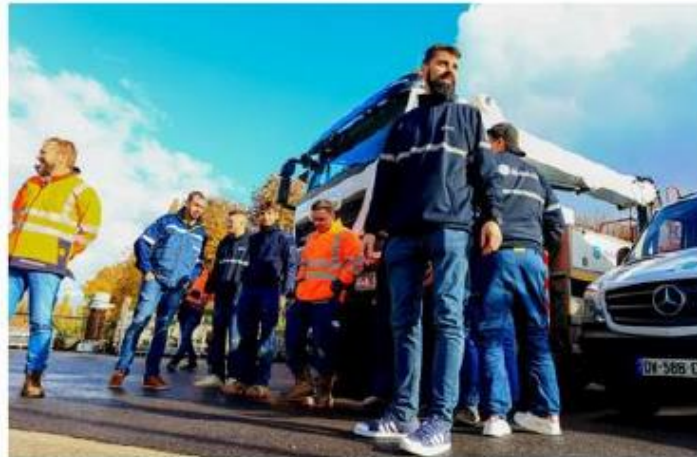
Une équipe de 15 agents de réséda, gestionnaire du réseau d'UEM, sont partis en Bretagne ce mardi.

Dès jeudi dernier, Enedis (anciennement ERDF) a déployé un « dispositif exceptionnel » de 3 400 techniciens, dont 1 400 salariés volontaires de la